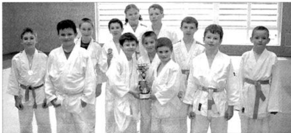
Bonne prestation des poussins