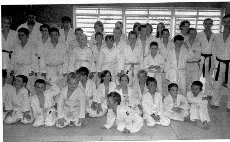
Une pose pour la fin de l'année

Les cours hebdomadaires de judo et jujitsu s'arrêtent le temps des grandes vacances scolaires et reprendront en septembre.